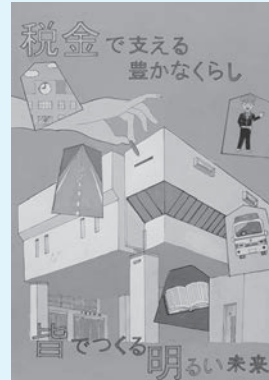
天童市長賞 堀越楓 (四中3年)