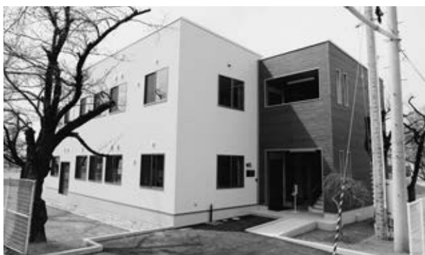
▲天童中央第二・第五学童保育所