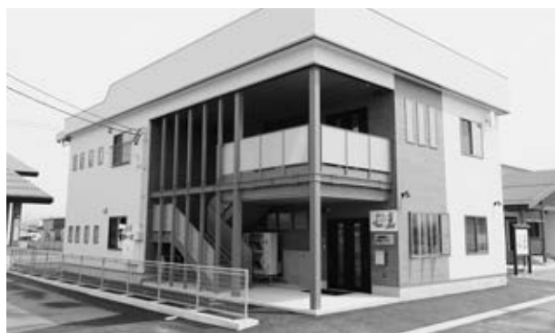
▲高掬第三・第四児童クラブ