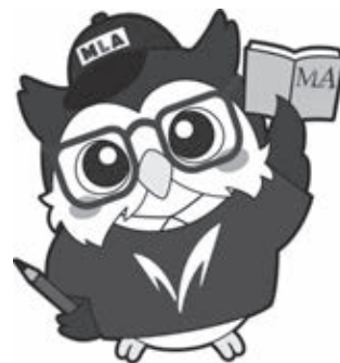
明治大学公式キャラクター めいじろう